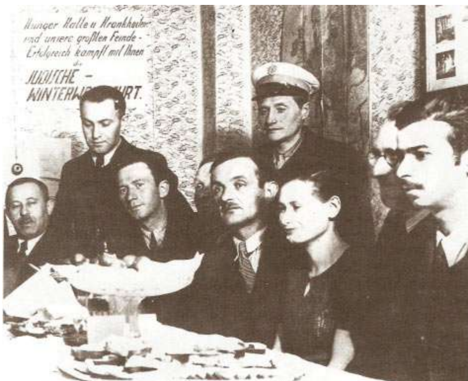
Rysunek 13 Członkowie Gminy Żydowskiej w pierwszych latach okupacji.