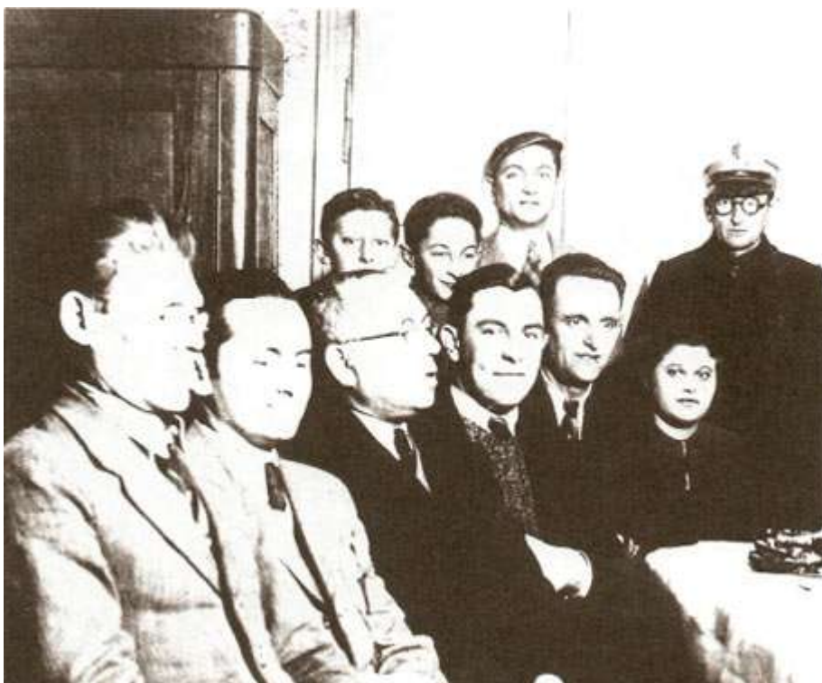
Rysunek 12 Członkowie Gminy Żydowskiej w pierwszych latach okupacji.