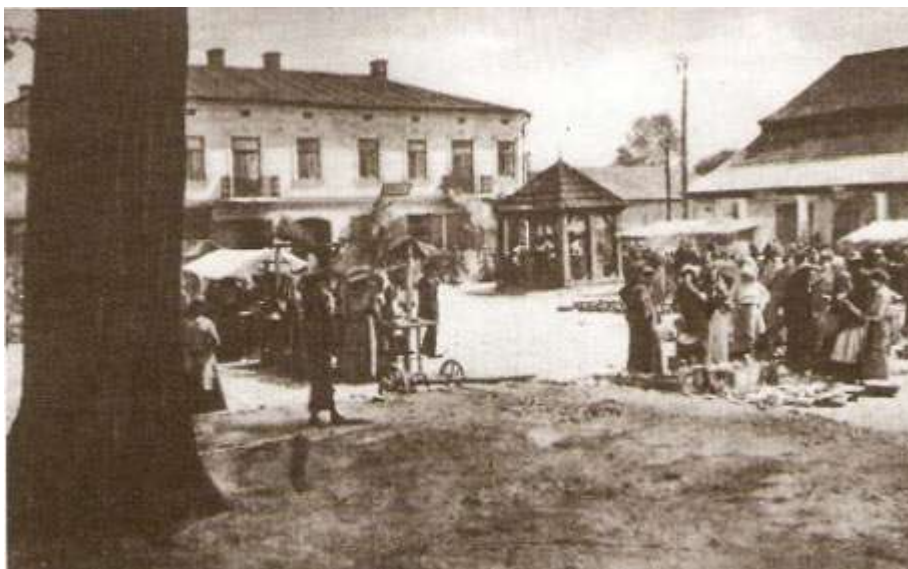
Rysunek 2 Rynek w dniu targowym, reprodukcja pocztówki wydanej przez R. Brandysa