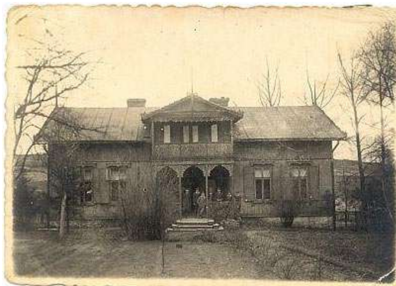
Rysunek 6 Sławkowski cheder przy ulicy Olkuskiej, fotografia z okresu międzywojennego